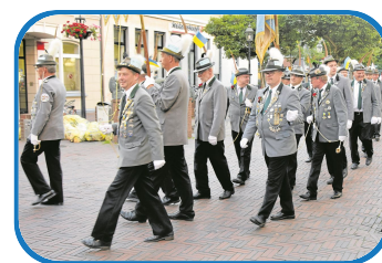
Am ersten Juli-Wochenende sind die Gilde-Schützen wieder in Buxtehude unterwegs.