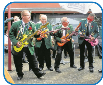
Bei den Hänselftouren regiert der Frohsinn. Das Grüne Rott ist für jeden Spaß zu haben und gibt auch mal ein bejubeltes Luftgitarren-Konzert.

heute haben wir das Jahr 2022, Kinder laufen nicht mehr bei den Hänselftouren mit, und sie sehen in den Schützen auch nicht mehr ihre Helden. Das bedeutet aber nicht, dass das Grüne Rott keine Fans mehr hat. Das zeigt sich schon in der Bereitschaft vieler, Gastgeber einer Hänselfstation des Grünen Rotts zu sein. Besonders zu erwähnen sind hier die Bäckerei Dammann, das Buxtehu-