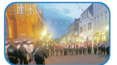
Gänsehaut-Stimmung: Großer Zapfenstreich vorm Rathaus.