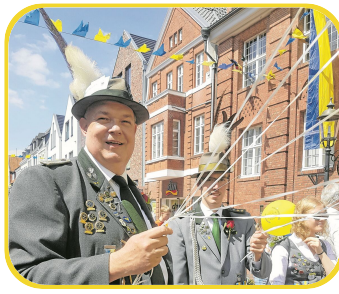
Nach der Zwangspause geht es jetzt endlich wieder weiter.